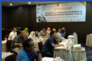
Workshop Evaluasi Minyak Bumi dan PPC